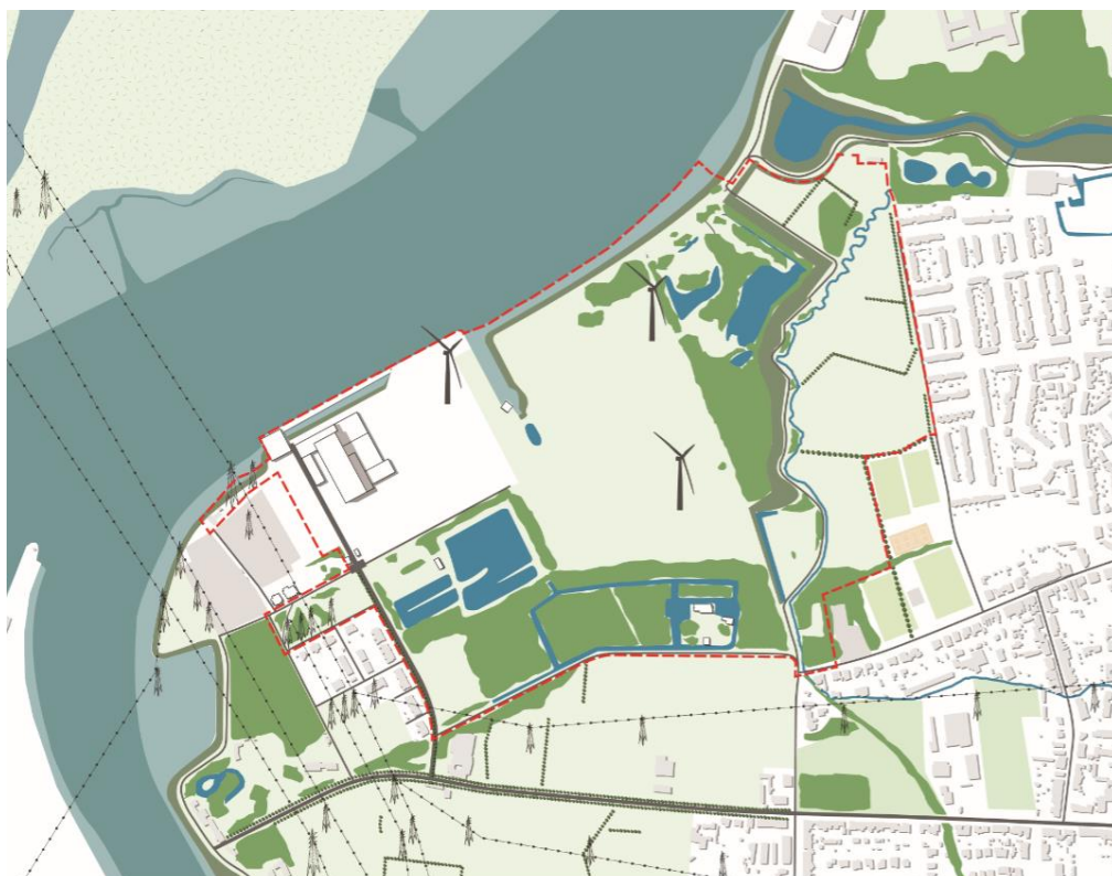
Afbeelding 2.1 Ruimtelijke context plangebied

Het 67,5 ha tellende plangebied is gelegen in het westen van de gemeente Schelle, in een uniek rivierenlandschap. Het ligt in de buitenbocht van de Schelde, net naast de monding van de Rupel. Het is na de Hobokense Polder de eerste open, nog natuurlijke rechter Scheldeoever stroomopwaarts van Antwerpen.