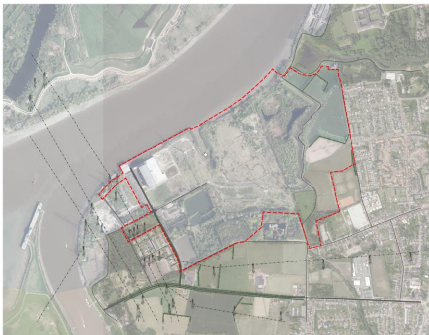
Afbeelding 2.1 Ruimtelijke context plangebied aangeduid op luchtfoto

Het plangebied heeft een bijzondere ligging door de aanwezige open ruimte. Het oude polderlandschap, rond de vallei van de Wullebeek, de Maeyebeek en de Vliet oogt, hoewel niet beschermd, sterk authentiek.