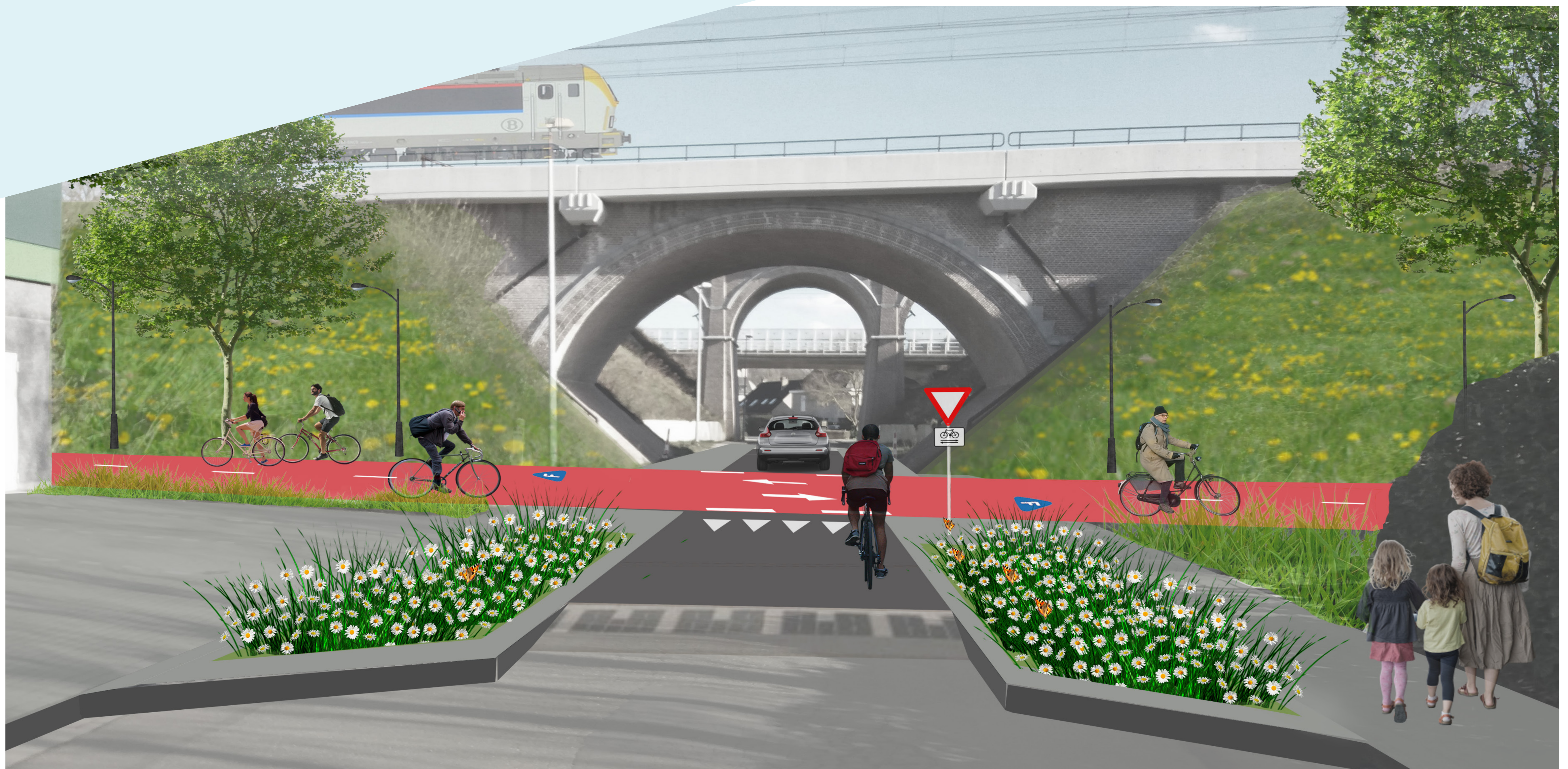
Sfeerbeeld gelijkgrondse kruising met enkelrichtingsverkeer voor auto's