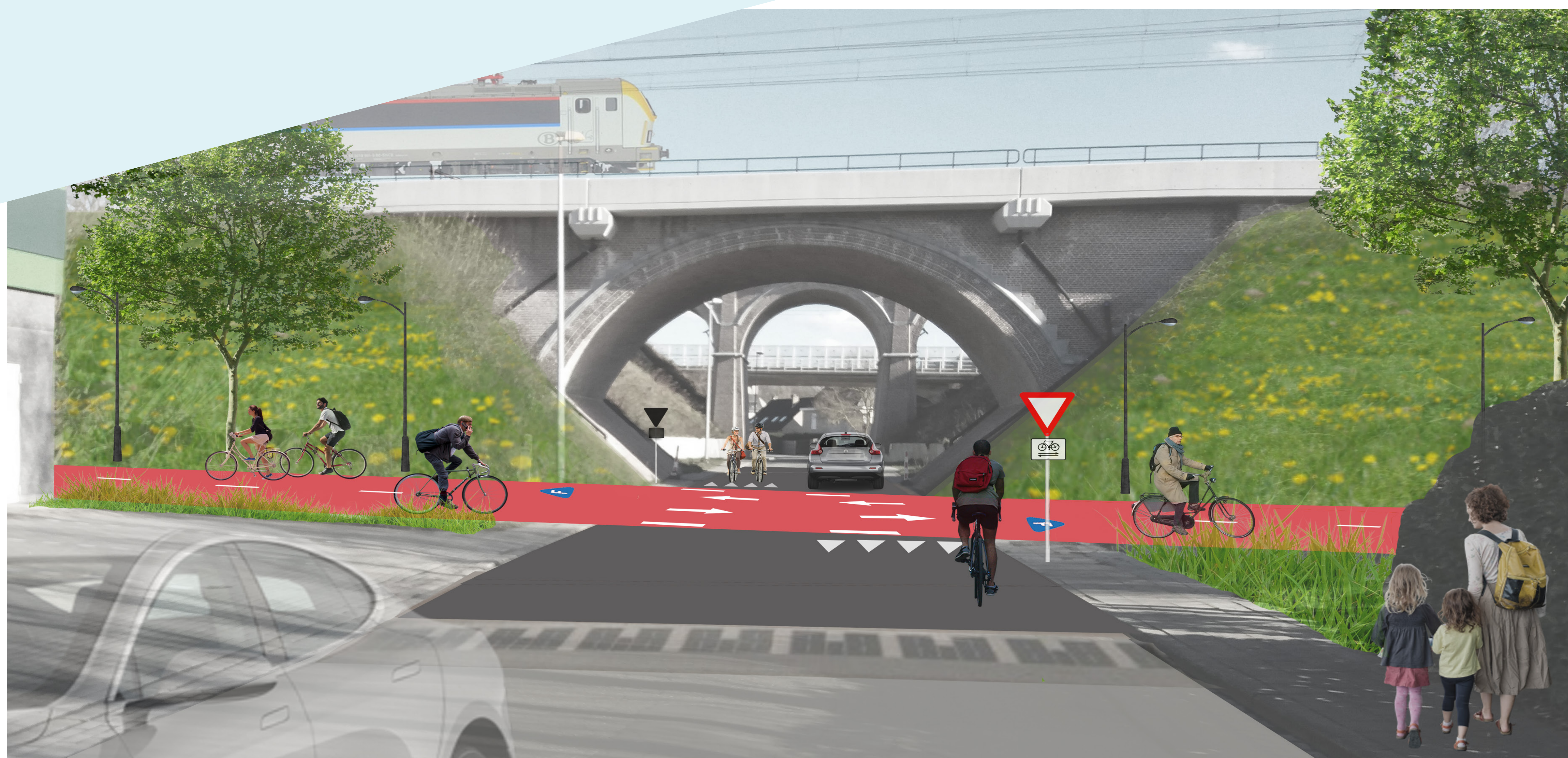
Sferbeeld gelijkgrondse kruising met dubbelrichtingsverkeer voor auto's