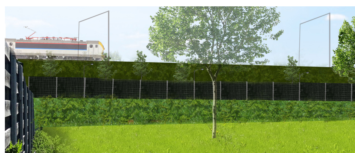
voorbeeld doorzichtig hekwerk en laag groen