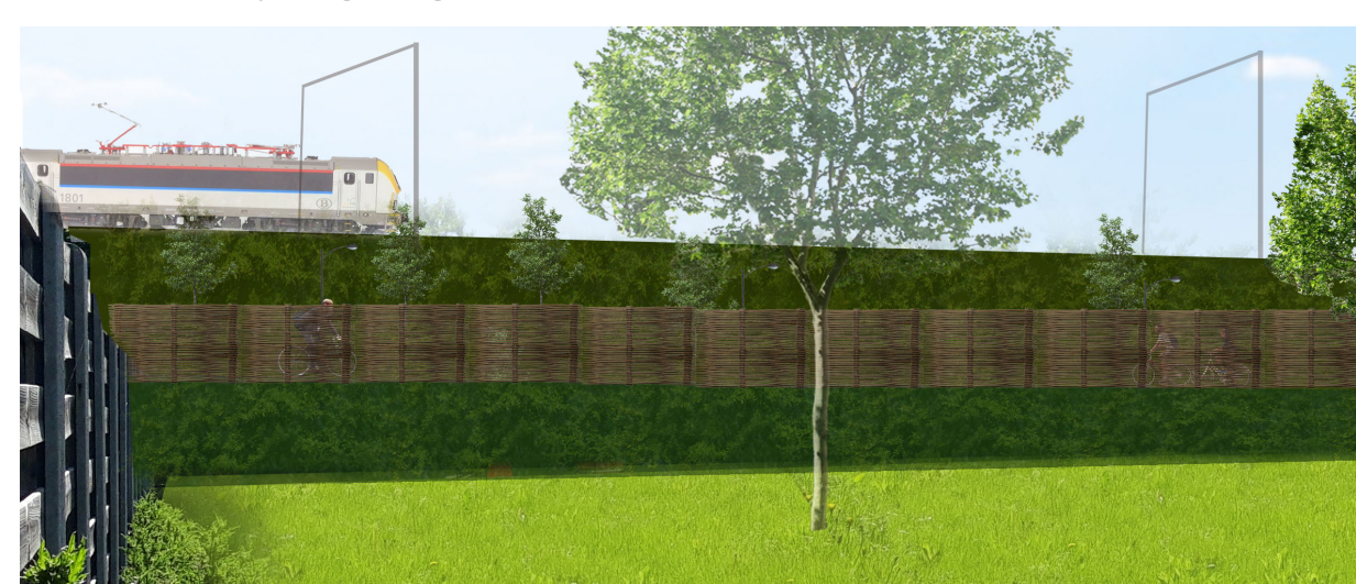
voorbeeld gevlochten wilgenscherm