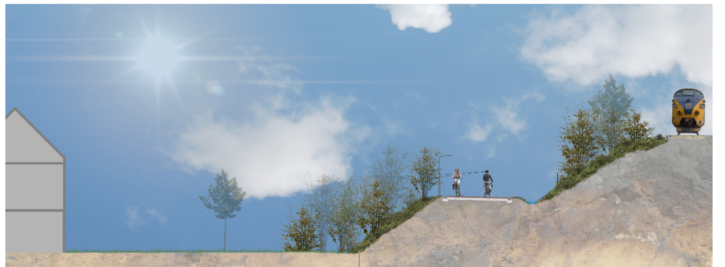
privaat perceel - tuin