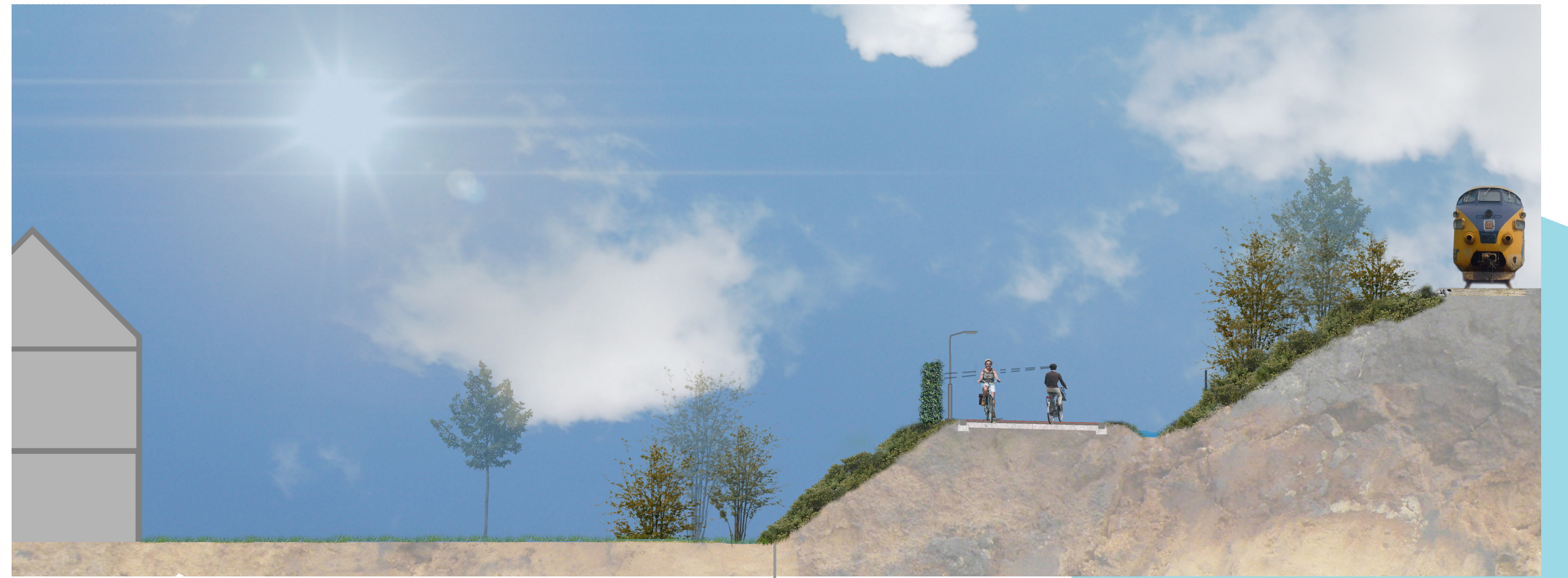
privaat perceel - tuin