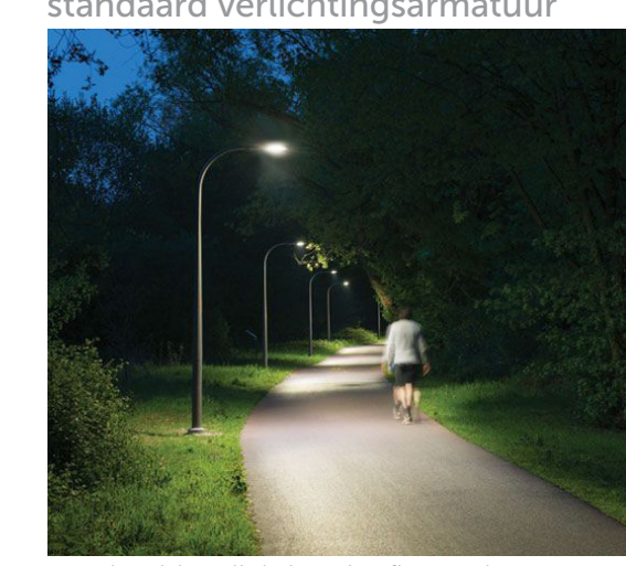
voorbeeld verlichting ringfietspad