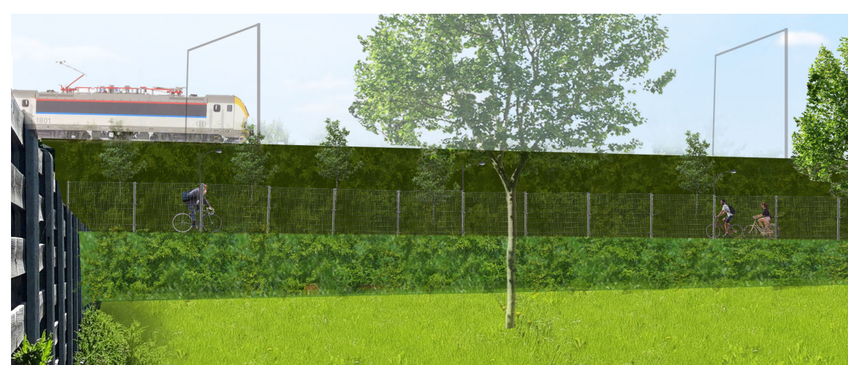
voorbeeld hekwerk en laag groen