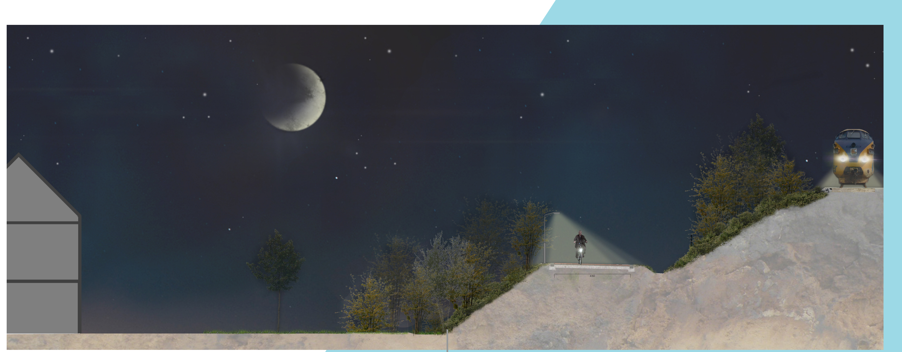
privaat perceel - tuin