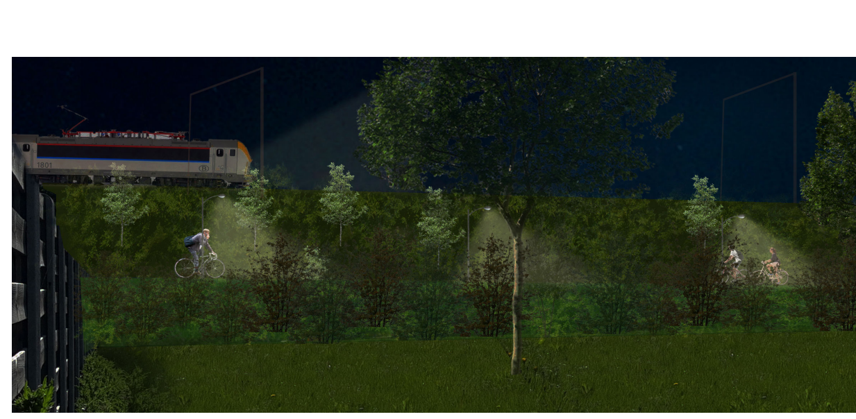
voorbeeld verlichting bij natuurlijk groenscherm