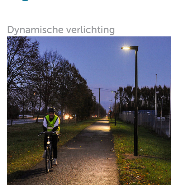
voorbeeld dynamische verlichting