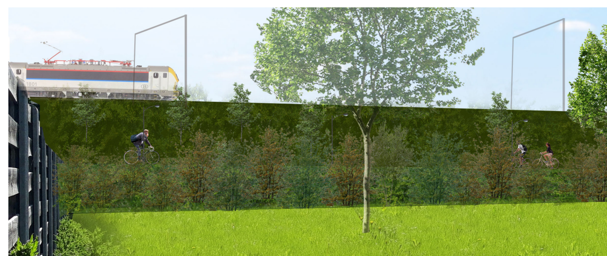
voorbeeld natuurlijke begrazing