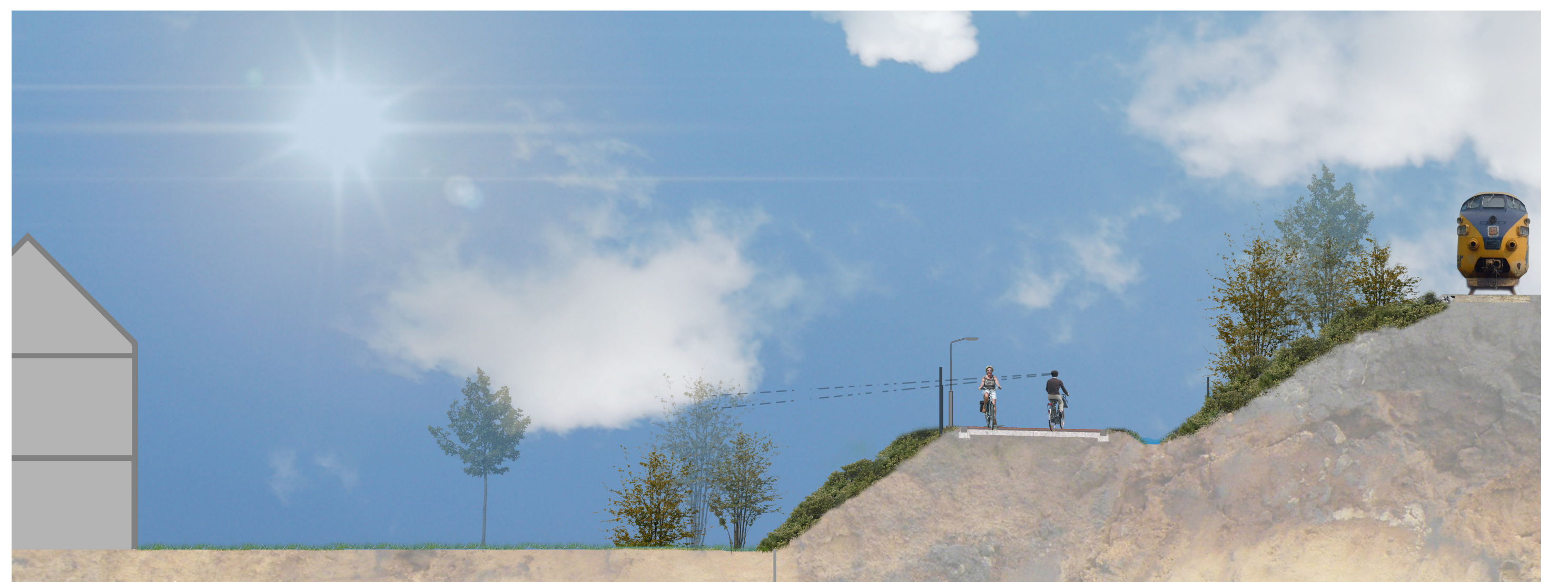
privaat perceel - tuin