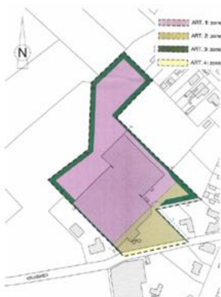
Figuur 1: gemeentelijk RUP Opsinjoorke

Doelstelling van dit RUP is het gebruik van deze zone voor het tuincentrum te optimaliseren en vast te leggen voor de toekomst en zo het ruimtelijke functioneren van de gehele zone te verbeteren. Tevens wordt na stopzetting van de bedrijfsvoering er een nabestemming vastgelegd die andere, meer hinderlijke activiteiten, uitsluit.