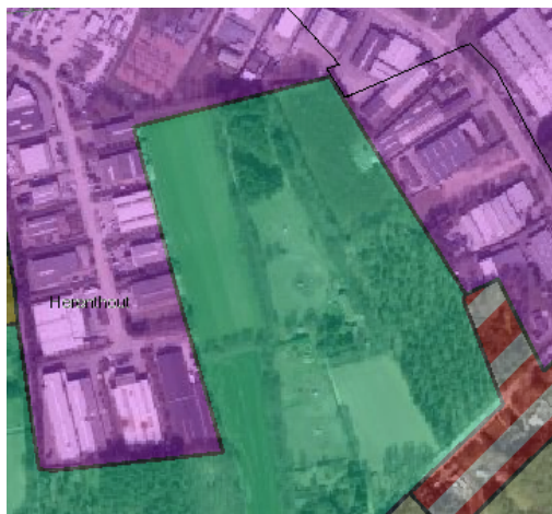
Figuur 3: bestemmingen gewestplan