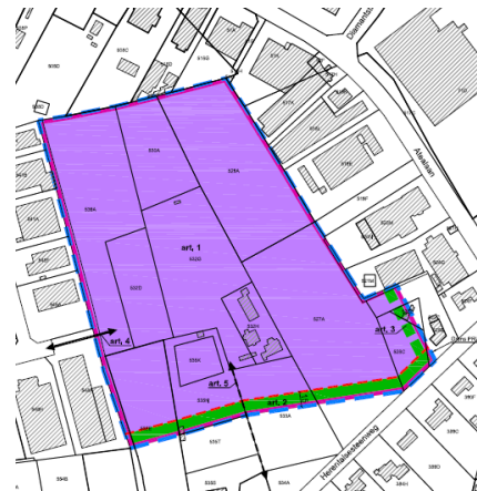
Figuur 4: ontwerp-PRUP