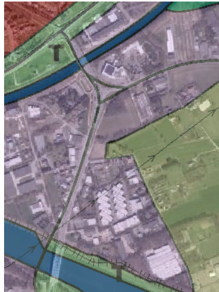
Figuur 3: bestemmingen gewestplan