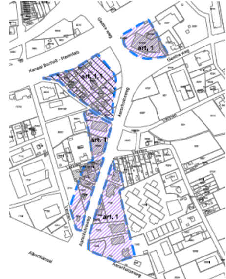
Figuur 4: ontwerp-PRUP