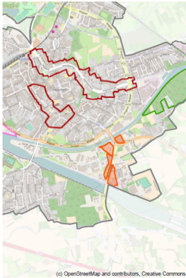
Figuur 2: Situering PRUP

Het PRUP voorziet bovenop de huidige bestemming kmo-zone een overdruk die beperkte uitbreiding en herstructurering van de detailhandelsconcentratie mogelijk maakt.