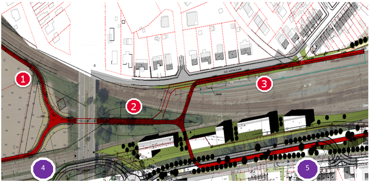
Figuur 3: brug onder ring en over sporen in Lier

De nieuw te bouwen fietsbrug biedt de mogelijkheid om 2 extra takken aan de brug te bouwen: de aansluiting van de fietsostrade Lint-Lier (F16) en de ontsluiting van de binnenstad van Lier. De bouw van deze 2 extra takken behoort niet tot het project van de provincie Antwerpen. (zie nummers 4-5 op de onderstaande figuur).