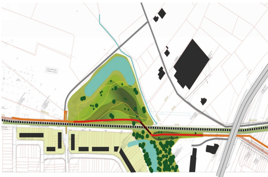
Figuur 2: brug over sporen in Mortsel

Segment 3 start vanaf de Krijgsbaan en loopt tot de gerealiseerde fietsostrade langs de Molenlei in Boechout. Vanaf de Krijgsbaan tot aan de Pater Renaat De Vostunnel loopt de fietsostrade naast de sporen op een eigen fietsweg. Op de grens van Mortsel en Boechout moet de fietsostrade de sporen kruisen. Uit onderzoek blijkt dat de bouw van een tunnel technisch zeer moeilijk is. Daarom is een fietsbrug voorzien. Via EFRO-middelen kan de provincie Antwerpen een deel van de investeringsmiddelen recupereren. Om aanspraak te kunnen maken op deze EFRO-steun moet de brug in 2019 klaar zijn. Daarom krijgt dit project absolute voorrang en voert de provincie Antwerpen het prioritair uit.