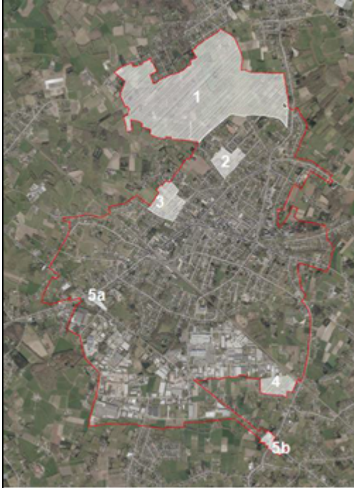
Fig. 2 Situering PRUP Afbakeningslijn

Bij de bepaling van de afbakeningslijn werd rekening gehouden met grensstellende en sturende elementen vanuit natuur, landschap, landbouw en water.