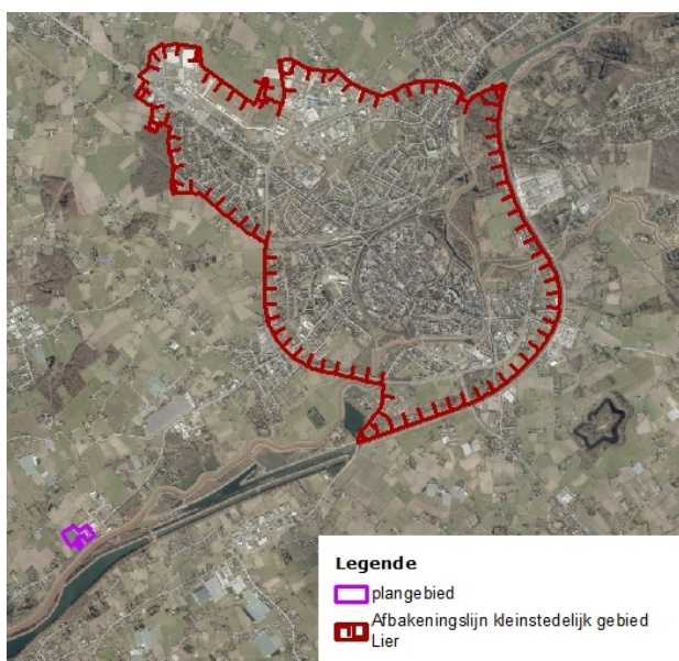
Fig 1: situering tov kleinstedelijk gebied Lier

Het PRUP wordt opgemaakt n.a.v. de afgifte van een voorwaardelijk gunstig planologisch attest. Het PRUP omvat de site van bedrijf Janssens nv (productie en groothandel van veranda's) en zusterbedrijf Janssens Veranda's bvba (plaatsing bij particulieren). De site is gelegen in Lier langs de Mechelsesteenweg, buiten het kleinstedelijk gebied. De gewestplanbestemming is agrarisch gebied en zone voor milieubelastende industrie.