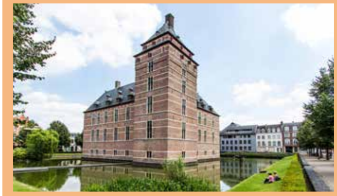
Kempen innovatieve groene regio