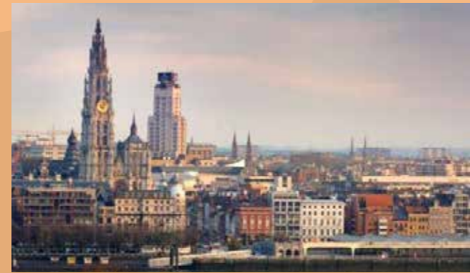
Antwerpen internationale havenstad