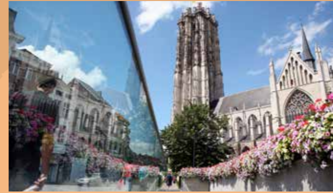
Mechelen historische cultuurstad